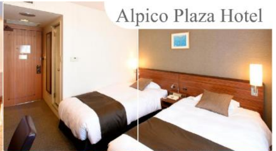
Alpico Plaza Hotel