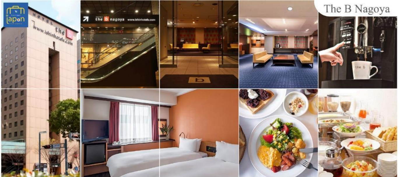
The B Nagoya